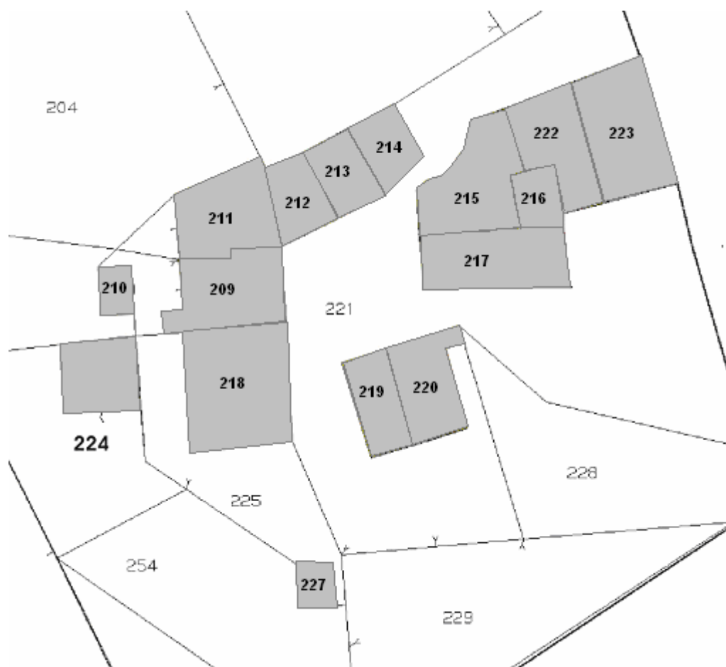
Stralcio di mappa catastale